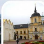
РИЗНИЦА ТРОИЦЕ-СЕРГИЕВОЙ ЛАВРЫ