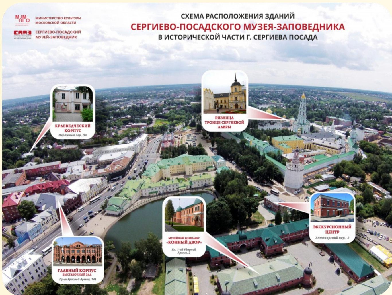
СХЕМА РАСПОЛОЖЕНИЯ ЗДАНИЙ СЕРГИЕВО-ПОСАДСКОГО МУЗЕЙ-ЗАПОВЕДНИКА В ИСТОРИЧЕСКОЙ ЧАСТИ Г. СЕРГИЕВА ПОСАДА